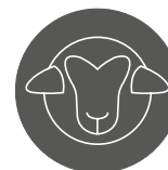
Warsztaty praktyczne z wykorzystaniem głów zwierzęcych

Czas trwania: 2 dni Cena kursu: 5000 zł brutto