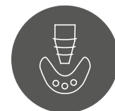
Warsztaty praktyczne z wykorzystaniem modeli

Czas trwania: 2 dni Cena kursu: 4650 zł brutto